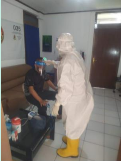
Follow Up Pasien Covid