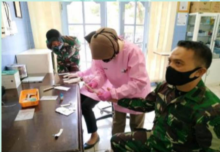
Pemeriksaan Rapid Antibody