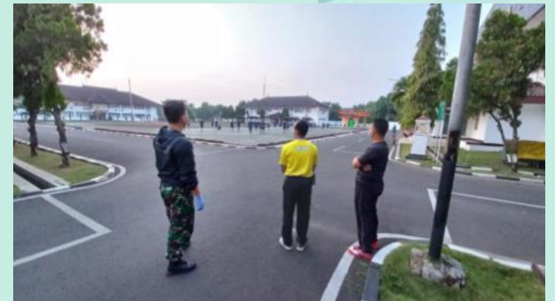
Dukes Olahraga Pasis