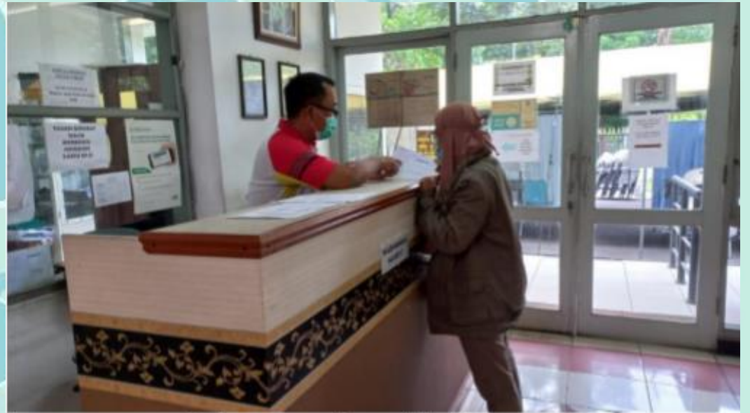
Pelayanan Surat Rujukan