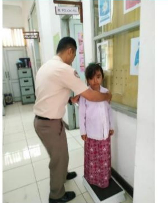
Mengukur Tinggi & Berat Badan