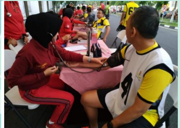
Pemeriksaan Tensi Samapta Pasis